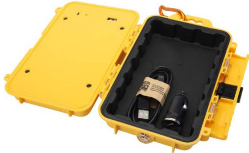
Cabo USB + Carregador veicular